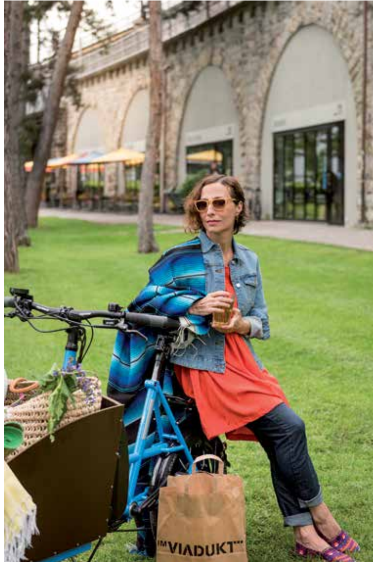
1 Josefswiese Viadukt Viaduktstrasse

Die Vorfreude auf das i:SY-Picknick beginnt beim Einkaufsbummel durch das Viadukt. Mit dem i:SY-Cargo direkt bis an die Markthalle und schon ist man nur einen Schritt entfernt vom Paradies der kulinarischen Köstlichkeiten. Heimische Backwaren und Käsespezialitäten finden den Weg in den Einkaufs-Picknickkorb, ebenso wie internationale Spezialitäten, zum Beispiel die Tapas aus Tokio. Den üppigen Einkauf ganz locker verstaut und dann ab damit auf die Josefswiese. Eine grüne Oase gleich um die Ecke, mitten in der City. Das i:SY-Cargo ist hier der Platzhirsch, gleich im doppelten Sinne. i:SY going, i:SY-Picknick. Ein schöner Tag.