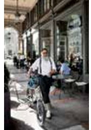
8 \ Café Metropol Frauenmünsterstrasse 12