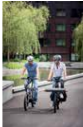
11 \ Guggach Quartier Käferholzstrasse