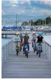
2 \ Cassiopeiasteg Seestrasse / Ecke Hoffnungsweg