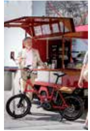
4 \ Polyterrasse ETH Leonhardstrasse 34