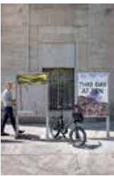
5 \ Kunsthhaus Hirschgraben 8