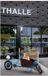
1 \ Markthalle Viaduktstrasse