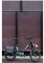
12 \ Guggach Quartier Käferholzstrasse