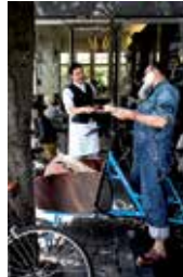
6 \ La Stanza Bleicherweg 10