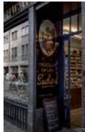
10 \ Café Schwarzenbach Münstergasse 7