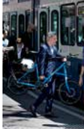
7 \ Platz Bellevue