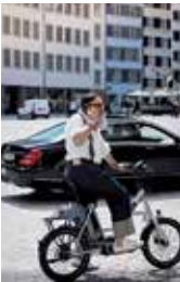
9 \ Züghusplatz