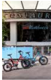
3 \ SAHltimbocca Längernstrasse 37